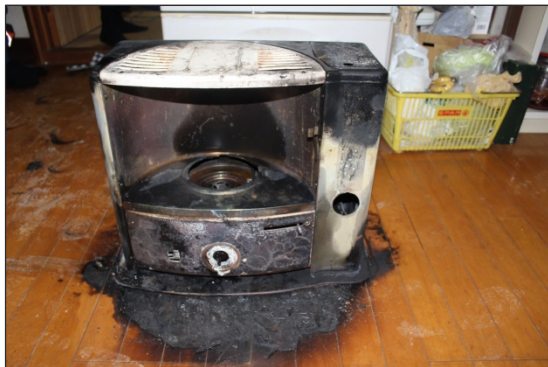
▲石油ストーブ周辺の焼損状況