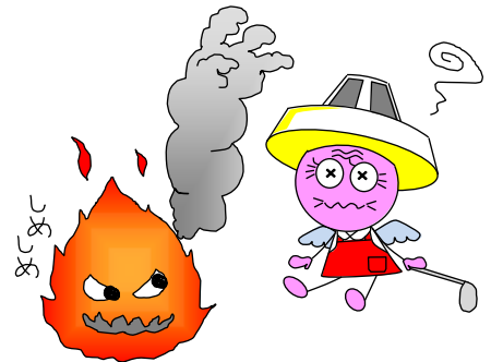
老 朽 化