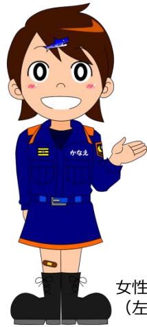
女性消防吏員活躍推進オリジナルキャラクター (左) かなえちゃん (右) みなみちゃん

一般家庭のダイニングキッチンモデルとした室内で、地震のおそろしさや、地震が発生したときの行動を学びます。